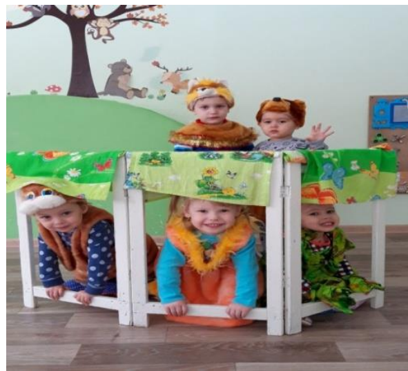
Рис. Костюмированный театр «Теремок». гр. «Непоседы» (3 года)

культуры речи, развитие артикуляционной моторики, речевого дыхания.